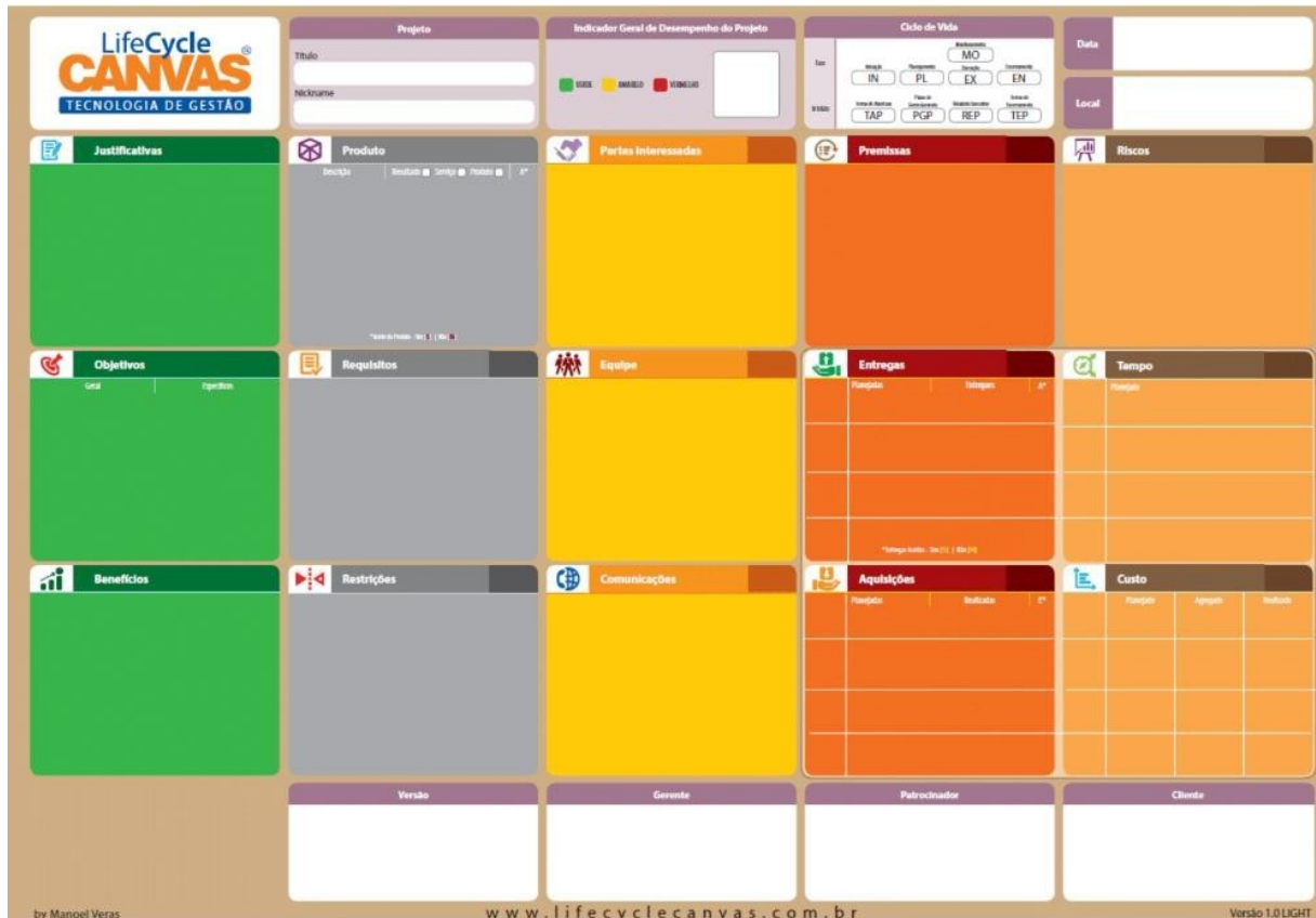
Figura 1. Modelo Life Cycle Canvas

O EGP vai fazer a gestão dos projetos de transformação digital na organização baseado nos 5 domínios propostos por (Rogers, 2017) no qual vai contemplar projetos nos domínios de clientes, competição, dados, inovação e valor.